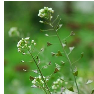
17. Csattogó szamóca