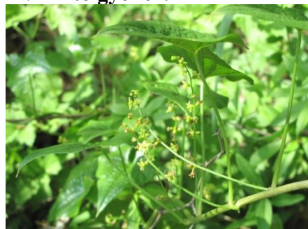
22. Pírtó gyökér: